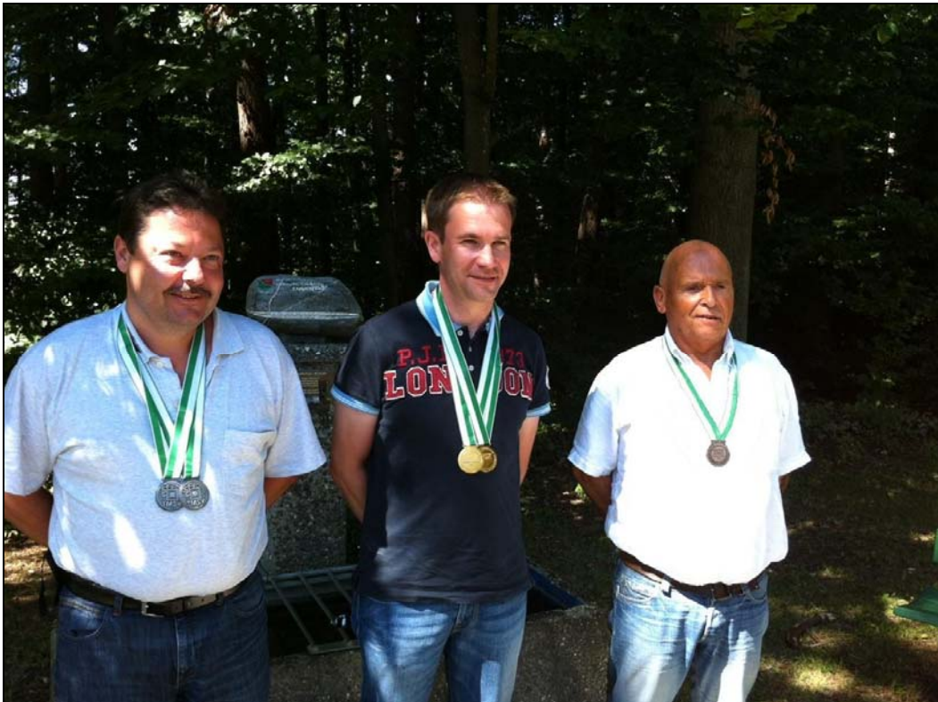
Medaillengewinner Sportgewehre Liegendmatch, Einzelwertung

1. Frauenfeld 2'272 Pkte. 2. Oberthurgau (unvollständig) 1'699 Pkte.